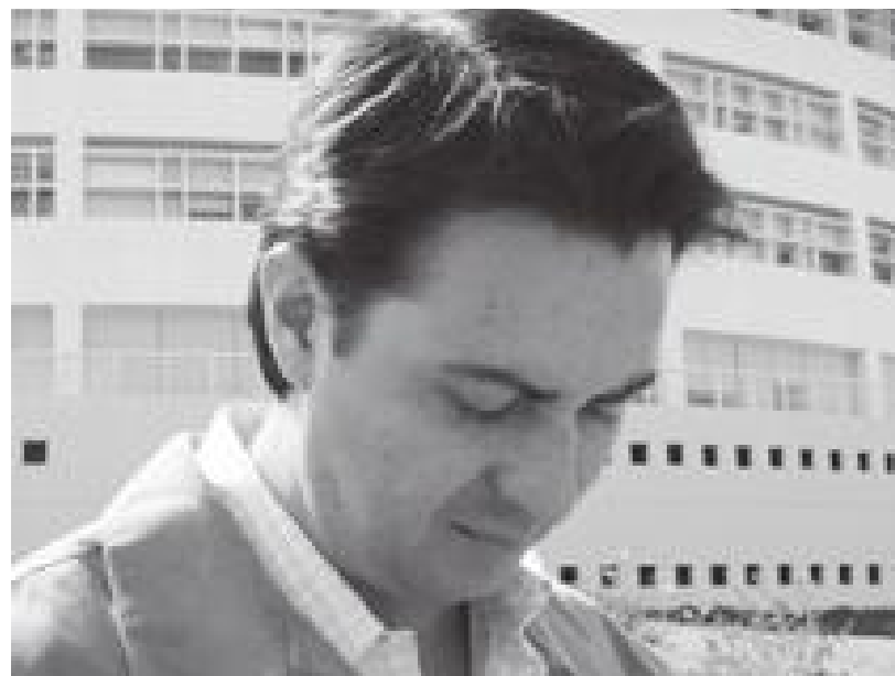
No modificaré mi postura respecto al aborto, sentenció el presidente de la CEDH.

El presidente de la CEDH puntualizó que si existieran los elementos necesarios, señalaría la posibilidad de que es un feminicidio, a partir de un conocimiento, ya tenemos una queja, sin embargo dijo que no pueden especular, “hacer pronunciamientos a la ligera, por lo menos la Comisión no”.