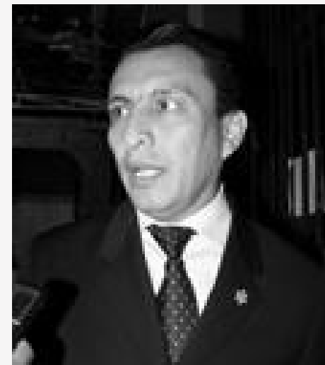
De acuerdo con los monitoreos que realizamos, no ha subido de forma alarmante la inseguridad, señaló el funcionario público.