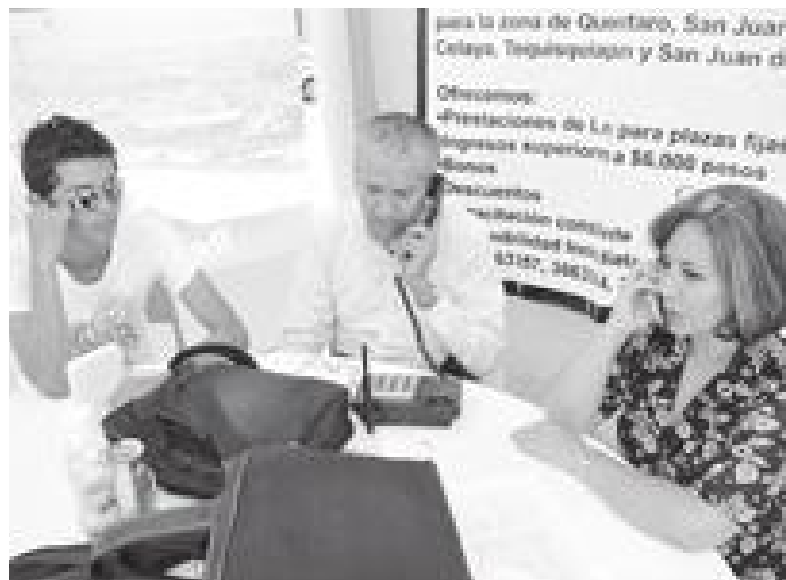
Las empresas outsourcing infringen el contenido de la Ley Federal del Trabajo, manifestó el diputado priista en San Lázaro.

"Muchas veces los outsourcing hacen únicamente el proceso de preselección y usan sólo una determinada prueba para características en los perfiles, ahí sí puedo aplicar la misma prueba para todos los perfiles, porque no es muy específico".