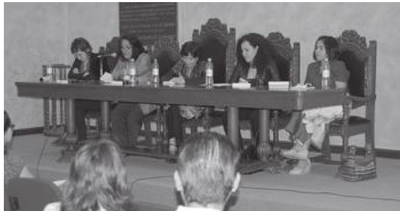
En instalaciones de la Facultad de Filosofía de la UAQ, académicas y militantes feministas reflexionaron sobre la situación actual de la mujer en México.