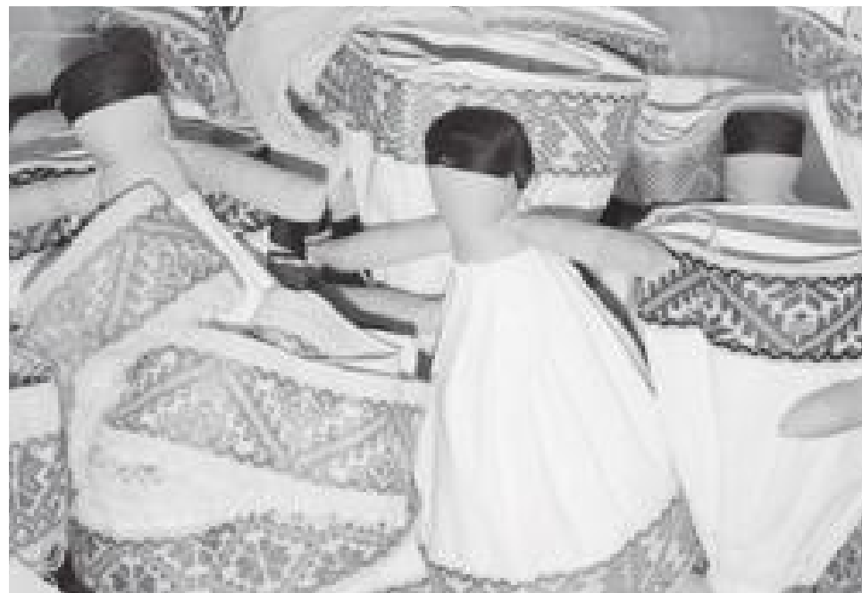
Bolsas, manteles y trajes típicos son algunos de los productos que elaboran mujeres otomíes, y que exportan a otros países.