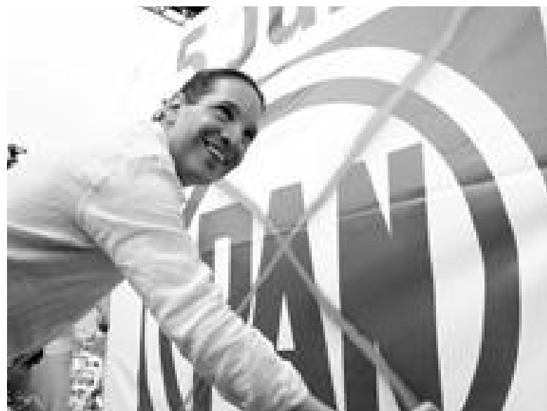
Los documentos entregados al IEQ señalan que el alcalde de la capital no sólo sobrepasó el tope de campaña, sino que además todos sus recursos provinieron de particulares.

“Generalmente se nulifica la elección cuando los candidatos rebasan los toques de gastos de campaña o si se hacen actividades anticipadas de campaña muy visibles y que generen inequidad”, manifestó Eduardo