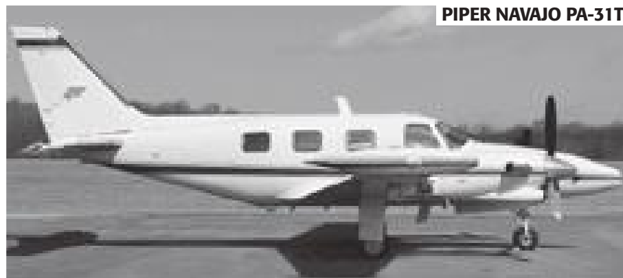
PIPER NAVAJO PA-31T

Lo que conocemos... es que ese avión es la extensión de un "centro comercial"... y bueno, eso es lo que sabemos... ¡Imagínate nada más lo que no sabemos, de lo que no estamos enterados los queretanos!" - palabras del hoy gobernador, entonces senador de la República, José Calzada Rovirosa, en entrevista para la revista Libertas , 31 de marzo del 2009.