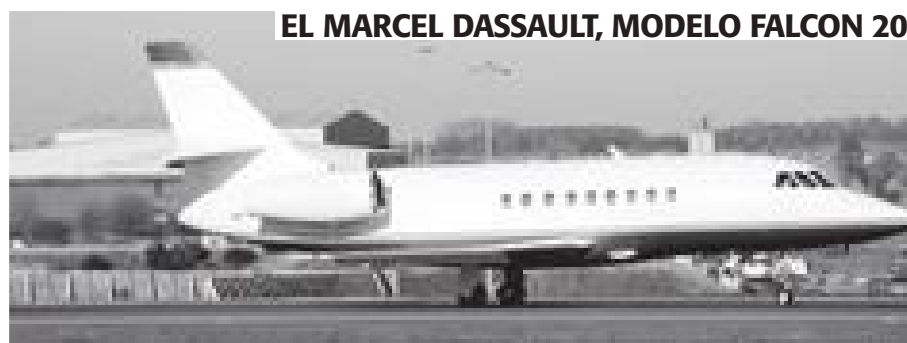
EL MARCEL DASSAULT, MODELO FALCON 20

• Es un aeroplano bimotor diseñado para el transporte de pasajeros y cargas pequeñas (modelo al que pertenece el Fray Junípero ). Tiene cabida para nueve personas (tripulación: dos; pasajeros: siete), y el peso máximo que soporta al despegar es de cerca de tres mil kilogramos. La velocidad crucero que tiene el motor de esta aeronave es de cerca de 380 kilómetros por hora, y consume aproximadamente ocho galones de combustible por hora. El combustible cuesta alrededor de 10 pesos el litro.