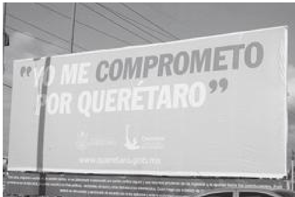
“Si me dicen ‘yo me comprometo’, pues bien por el señor, se comprometió, pero eso a mí qué. La base de la publicidad debe ser que yo como público entienda cuál es el beneficio”, criticó el especialista.

“De un tiempo para acá los gobiernos han empezado a construir marcas que promueven ciertas actitudes dentro de la ciudadanía. Se busca que los gobiernos perduren en la mente de los gobernados, que de alguna manera peerme para las próximas elecciones y para que se busque la continuidad”, manifestó el mercadólogo.