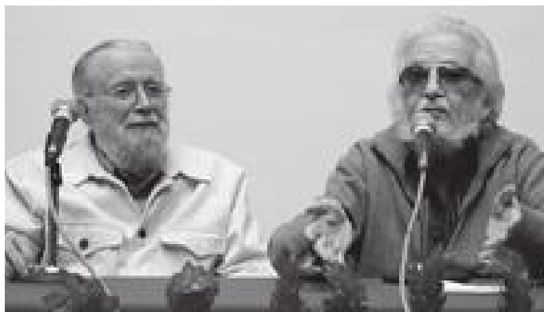
Los literatos compartían micrófono y opiniones sobre el desarrollo de México en el último siglo, el nivel actual de educación nacional y la literatura del antes y del ahora.

Fernando Del Paso ha sido acreedor de reconocimientos, entre los que destacan el Premio Xavier Villaurrutia (1966), Premio de Novela México (1976), Premio Internacional Rómulo Gallegos (1982), Premio a la Mejor Novela Publicada en Francia, y el Premio a las Artes y Humanidades Hugo Gutiérrez Vega (2010).