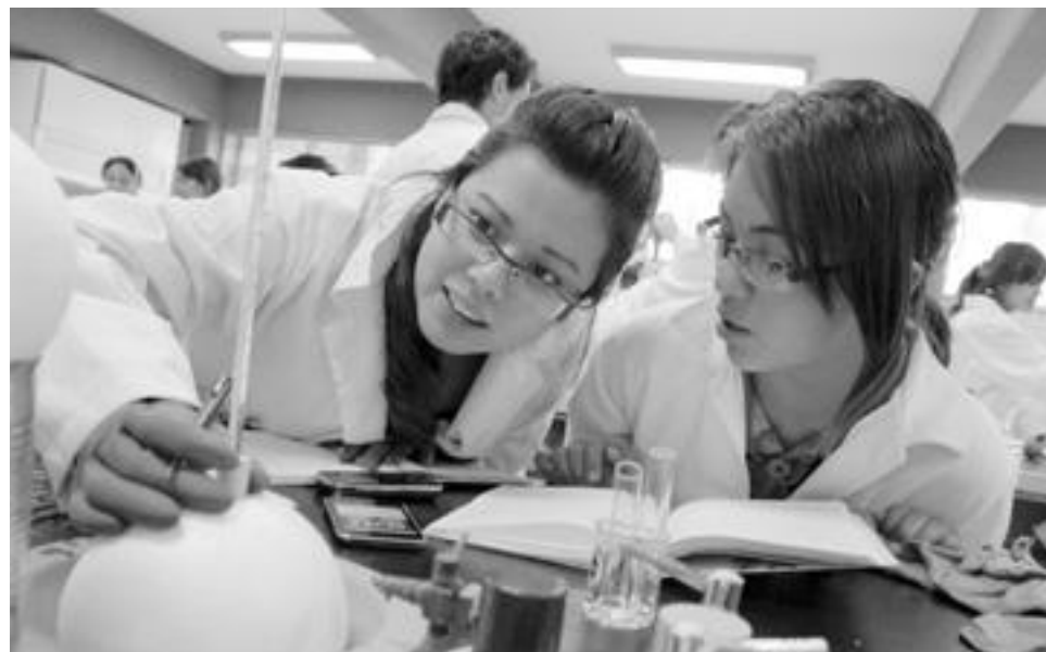
La plataforma estará lista a inicios del próximo año y se contempla atender inicialmente a 50 micro, pequeñas o medianas empresas.

representa, pues no sólo es poner a la venta un producto sino también el contacto que implica con el cliente, resolver dudas, dar la confianza de que hay alguien detrás. Una de las diferencias de la plataforma que desarrollaremos es que contendrá un registro de la empresa para dar la certeza de que existe y también para que los usuarios cuenten con una dirección a la cual acudir si hay dudas o inconformidades", agregó.