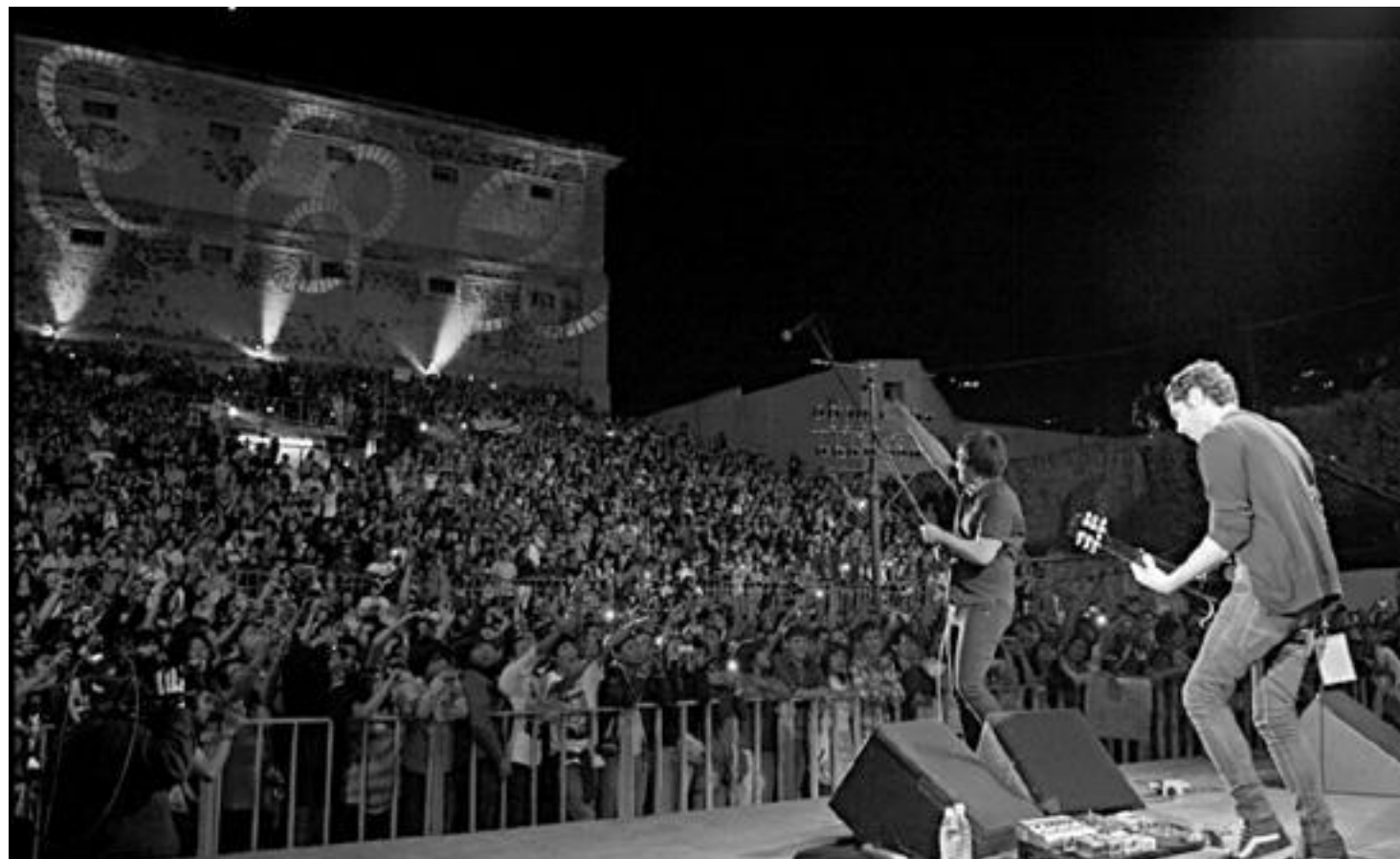
Durante el Festival Cervantino se presentó el grupo Enjambre (en la foto)

Yo me quedo solo en un túnel subterráneo. Son las cuatro de la mañana y debo dormir en un algún lugar, en algún lugar que me permita olvidar el miedo y el asco que experimenté en Guanajuato.