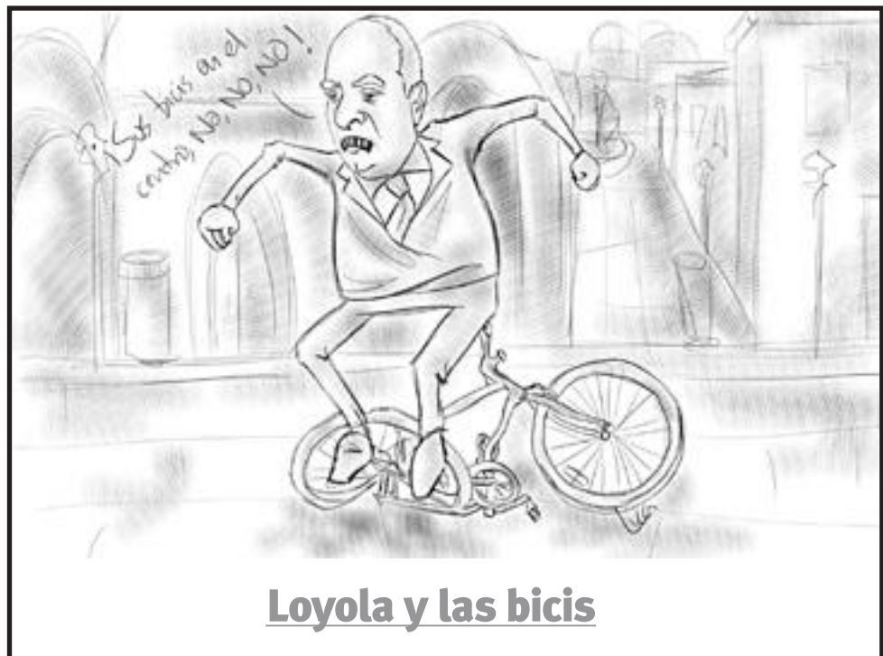
Loyola y las bicis