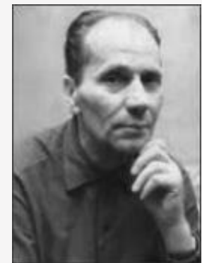
Miron Białozewski (Varsovia, 1922-1983). Poeta, novelista, dramaturgo y actor.

Todo está bien cuando está indemediado bien.