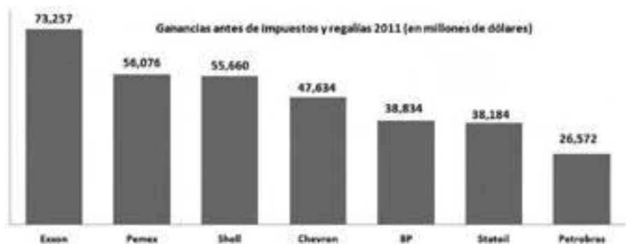
Figura 1: Ganancias de Pemex antes de impuestos y regalías en comparación con otras petroleras

Efectivamente, en la llamada "Reforma Hacendaria" que Peña Nieto presentó el pasado 8 de septiembre se contempla aumentar el Impuesto Sobre la Renta (ISR) del 30 al 32% para los contribuyentes cautivos con ingresos brutos superiores a los