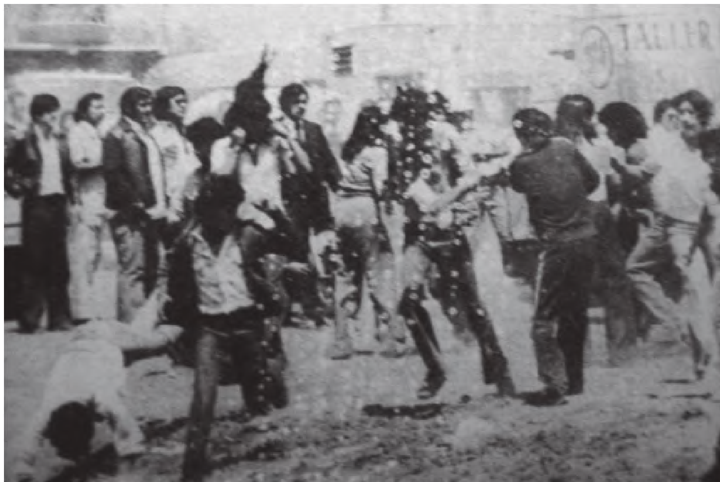
“Muestra la gráfica el momento preciso en que comenzó la desbandada de la manifestación de normalistas ante los gases lacrimógenos, los jóvenes empezaron a correr despavoridos”. Imagen tomada del Diario de Querétaro, 9 de mayo de 1980.

Conforme el día fue transcurriendo la envergadura del movimiento comenzó a ser más evidente. El último reporte de ese día fue emitido a las 22:20 horas en el cual se menciona una manifestación ocurrida a las 20:35 horas que culminó a las 21:45, en la que participaron estudiantes de la Normal y de la UAQ protestando por la represión. Los estudiantes avanzaron por la avenida Hidalgo y se detuvieron en frente del Palacio de Gobierno donde gritaron consignas contra el gobernador, Rafael Camacho Guzmán, cómo “Camacho y Somoza son la misma cosa, Muera la procuradora, al fin que es picadora y Chingue su madre el negro Camacho”; otro grupo “de unos 200 estudiantes” se dirigió a casa del gobernador con la intención de hacer pintas, pero fueron detenidos por sus propios compañeros, por lo que “únicamente gritaron palabras groseras, mentándole la madre al C. RAFAEL CAMACHO GUZMÁN” y posteriormente se unieron con el resto del contingente en el Jardín Obregón (Zenea) donde escucharon un mitin. Cabe destacar que la manifestación comenzó con “350 estudiantes aproximadamente y al llegar al exterior de Palacio de Gobierno habían aumentado a unos 1000” lo cual demuestra el impulso que el movimiento había tomado y que tomaría en los días consecuentes ahora que contaba con el apoyo del alumnado de la UAQ.