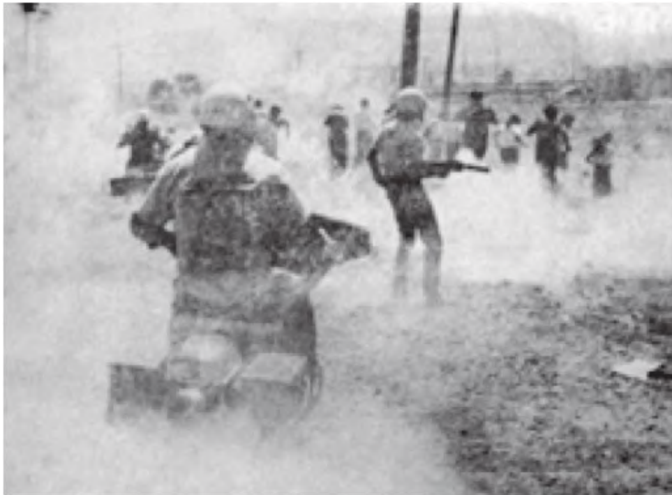
“con motos y rifles de gas lacrimógeno, los uniformados comenzaron a dispersar el grupo” Imagen tomada del Diario de Querétaro, 9 de mayo de 1980.

los maestros serían cesados, pero la directora permanecería como tal.