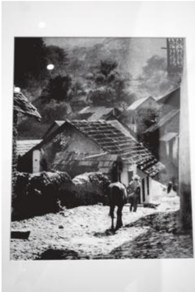
Esteban Galván, paisaje de Pinal de Amoles Querétaro, década de 1960