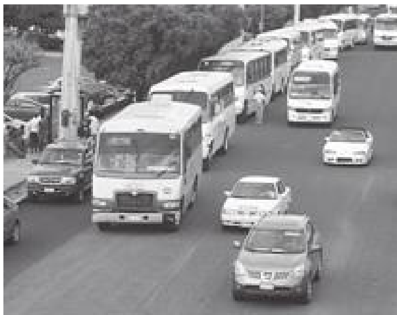
Bucio Paredes señaló que uno de los grandes problemas que enfrenta el transporte público en Querétaro es la sobreoferta de unidades.

“Esto ocasiona que la tarifa se eleve y se tengan costos de operación mayores”, finalizó.