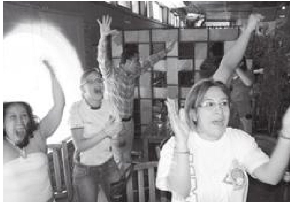
El Mundial de fútbol sirve para “salirse de las preocupaciones más fuertes”, señaló el Director de la Facultad de Ciencias Políticas y Sociales de la UAQ.

Un ejemplo es el alza en algunos productos o servicios, explicó: “todos sabemos de un constante incremento a las gasolinas, diesel, energéticos. Resulta curioso que el sábado antes de comenzar el Mundial se decreta que no iba a haber incremento; inicia el mundial y sí sueltan el aumento”.