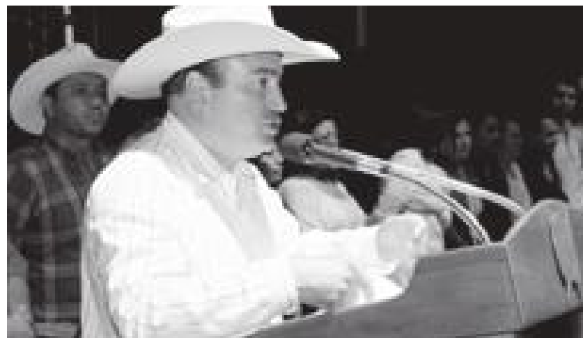
El alcalde de Corregidora, Carmelo Mendieta Olvera, durante la clausura de la Feria 2010, el domingo 6 de junio.