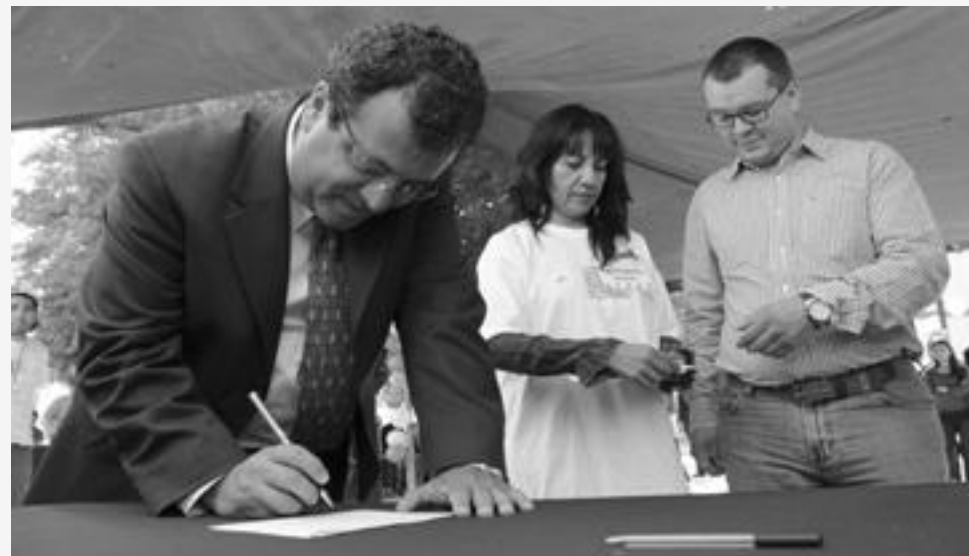
Autoridades universitarias participan en el programa Telegrama Ciudadano que llevan a cabo el IFE y el IEQ.

Al respecto, el Rector de la UAQ destacó la dinámica del programa para involucrar a la juventud en la democracia, pues “no es nada más el voto, sino que implica informarse y más tarde exigir y vigilar que las propuestas que se nos presentaron se cumplan”, expresó.