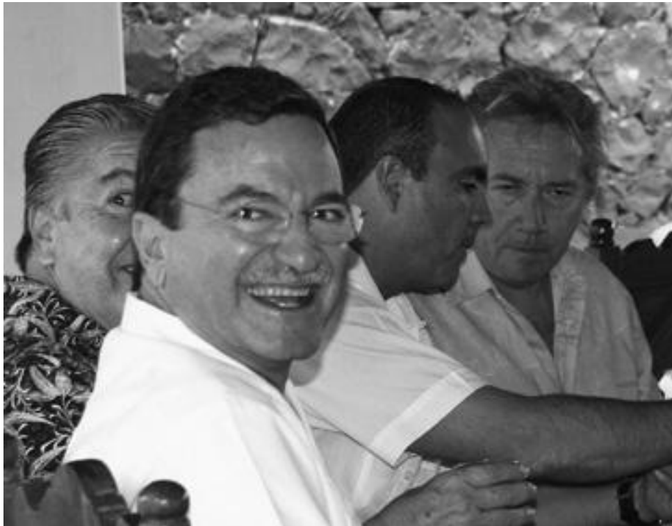
El poder detrás del poder