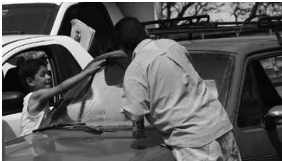
Padre e hijo ganándose el sustento en un crucero