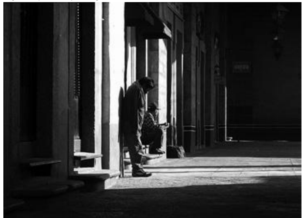
Ésta es nuestra realidad