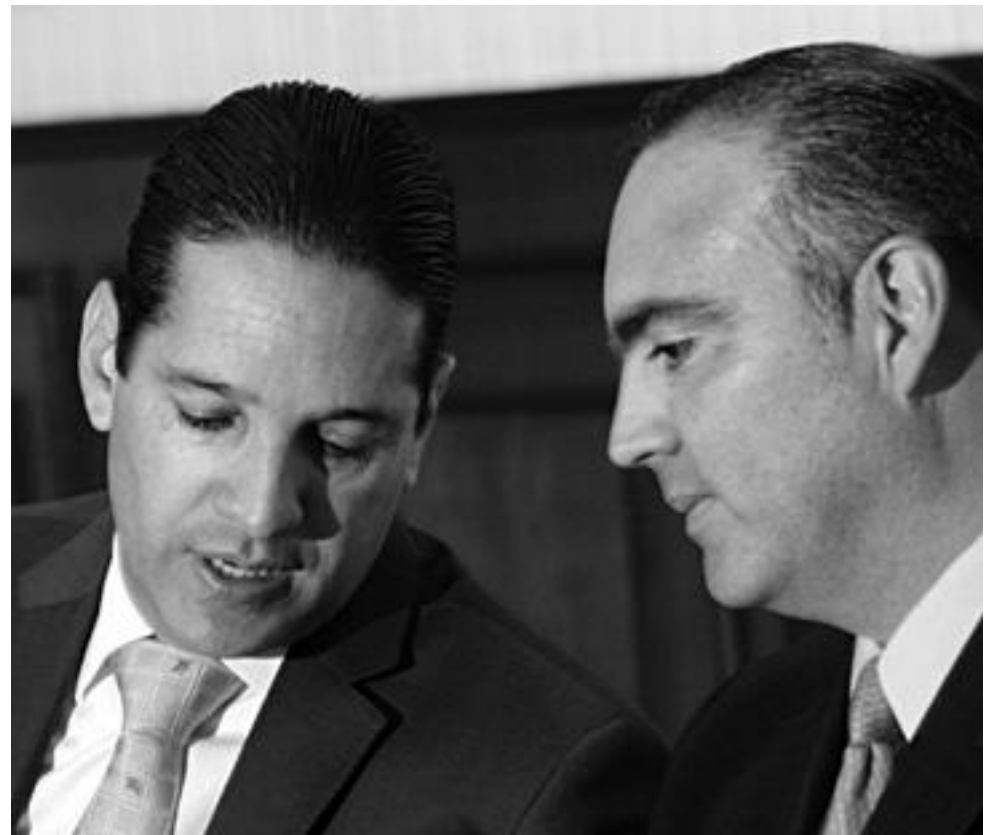
¿Adivina quién será el próximo gobernador de Querétaro?

Fotos y títulos de las mismas: Jesús Ontiveros