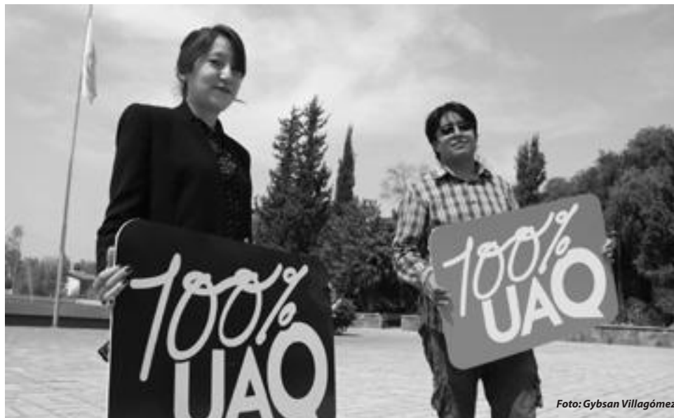
Los universitarios se medirán ante los mejores de toda la República Mexicana, así como de países invitados