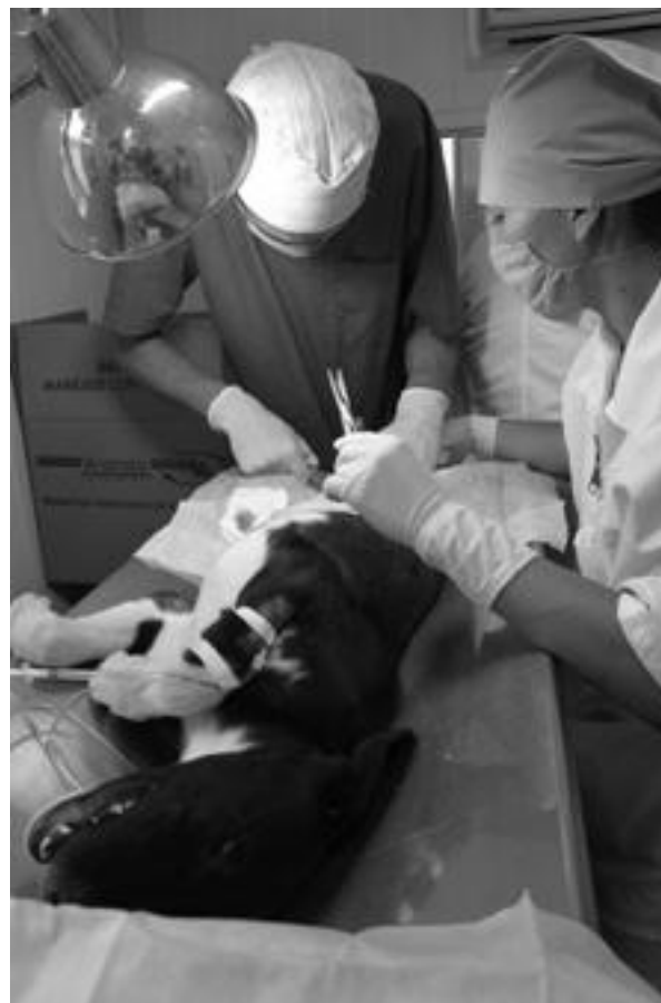
La Universidad cumple con su función de extensión al brindar este tipo de servicios a población de bajos recursos.

Son acciones sin fines de lucro, en las que no se cobra ningún procedimiento. Los requisitos que se solicitan para esterilizar perros es que estén totalmente sanos, muestren comprobante de vacunación o se aplique en la fecha programada y que esté desparasitado con 15 días de anticipación. Los dueños deben llevar a su mascota con correa y collar y esperar a que el paciente sea entregado; a la semana de ser operado deberán llevarlo para revisión y retiro de