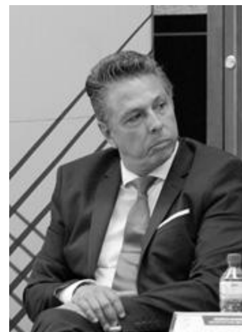
tido Revolucionario Institucional y Nueva Alianza.

Además, los lazos y prácticas del candidato lo vincularon en su campaña con el exgobernador José Calzada Roviroso, de quien nunca ha negado ser amigo; desde contratos publicitarios otorgados en su sexenio, hasta prácticas en la campaña. De acuerdo a la plataforma electoral del Instituto Electoral del Estado de Querétaro (IEEQ), el proyecto de Osejo lleva por nombre Volver a Creer, muy similar al nombre de la coalición de 2009 que postuló a Calzada: Juntos para Creer, conformada por el Par-