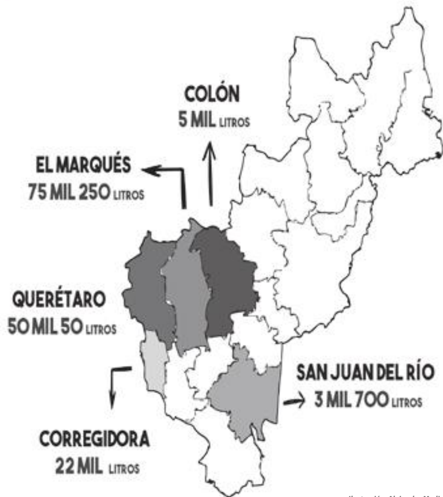
Ilustración: Alejandra Medina