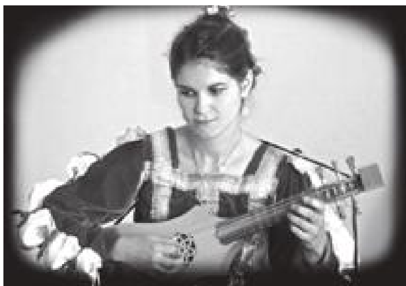
Los sonidos de instrumentos como la viola, el rabel y la fidula medieval caracterizan la música de Cantiga Armónica .