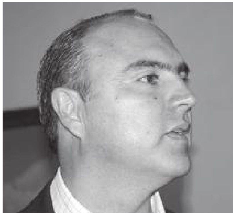
El programa de la tenencia vehicular fue muy inteligente, señaló la catedrática universitaria.