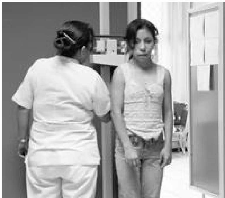
En el IMSS faltan recursos hasta para la atención médica básica, coincidieron en señalar usuarios y derechohabientes del instituto.

"Me parece que los médicos generales subestiman a los pacientes. Para ellos nunca se tiene nada, pero cuando llegas con los especialistas, son personas amables... todo lo contrario".