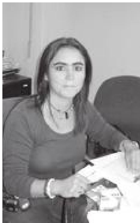
La directora de Protección Civil Municipal aseguró que las tormentas pronosticadas para este año sí podrían afectar al estado, pero existe la ventaja de tener tiempo para tomar medidas preventivas.

Con respecto a las 30 tormentas esperadas