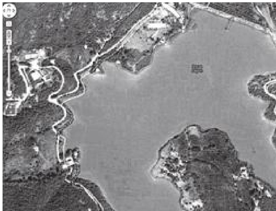
El río Escanela arrastra plomo, cadmio y cromo desde lo alto de la Sierra y los lleva hasta la presa de Jalpan, de donde los habitantes toman agua para su uso diario.