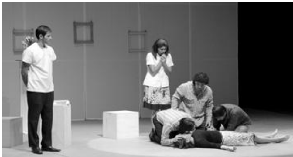
Estudiantes de la Facultad de Ciencias Naturales protagonizan la obra, dándole un toque de humor y desgracia al mismo tiempo