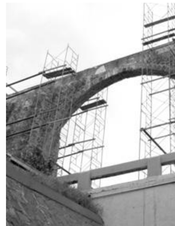
Seguir elevando bulevar Bernardo Quintana dañará la cuestión como el Acueducto

La lateral de Bernardo Quintana que circula de norte a sur, se vio afectada entre el jueves y el sábado debido al cierre del retorno que permite a los usuarios de este carril moverse hacia la colonia Calesa. La intención es continuar cerrando diversos tramos de Bernardo Quintana y avenida de Los Arcos hasta el miércoles 15.