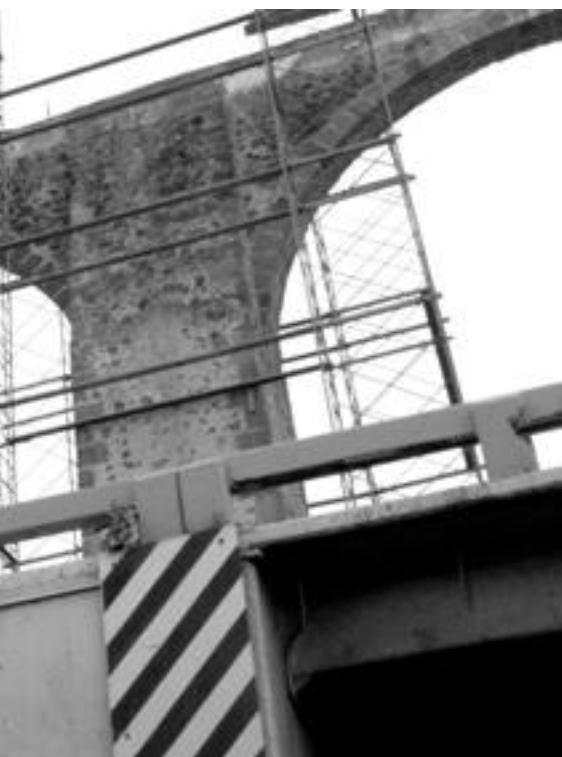
visual y armónica que demanda un monumento histórico

“La estructura que se sigue manejando en términos de organigrama sigue siendo muy pobre. Querétaro es una metrópoli y se tiene que tratar como tal”, finalizó.