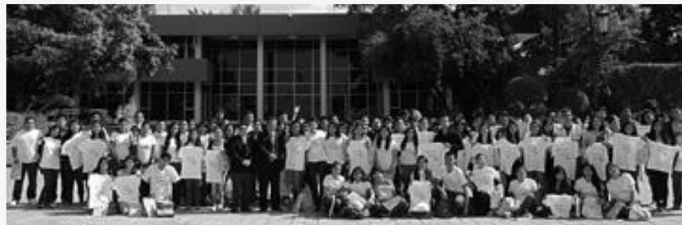
Del 29 de julio al 2 de agosto se replica este ejercicio de encuentro entre las autoridades universitarias, la comunidad estudiantil y sus padres.

Detalló que mientras el costo por semestre es de poco más de mil pesos, las asigna-