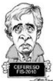
Rafael Barajas "FISGÓN"