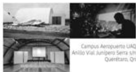
Campus Aeropuerto UAQ, Anillo Vial Junipero Serra s/n, Querétaro, Qro. GALERÍA. FORO ESCÉNICO. TALLERES Y OFICIOS. CENTRO DE DOCUMENTACIÓN EN ARTE DE VANGUARDIA Y ARTE CONTEMPORÁNEO.