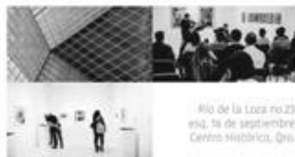
Río de la Loza no.23 vta. 1a de septiembre Centro Histórico, Qro. EXPOSICIONES, DIPLOMADOS, LIBRERÍA, PRESENTACIONES DE LIBRO, COLECCIÓN DE ARTE INDÍGENA.