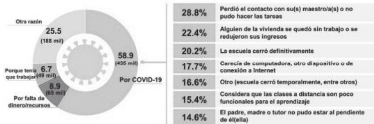
Distribución porcentual de la población de 3 a 29 años inscrita en el ciclo escolar 2019–2020 y que No concluyó el año escolar, por motivo de No conclusión y la razón principal cuando fue relacionado a la pandemia por COVID-19

Nota: la suma de motivos es mayor al 100% dado que se podía mencionar más de un motivo.